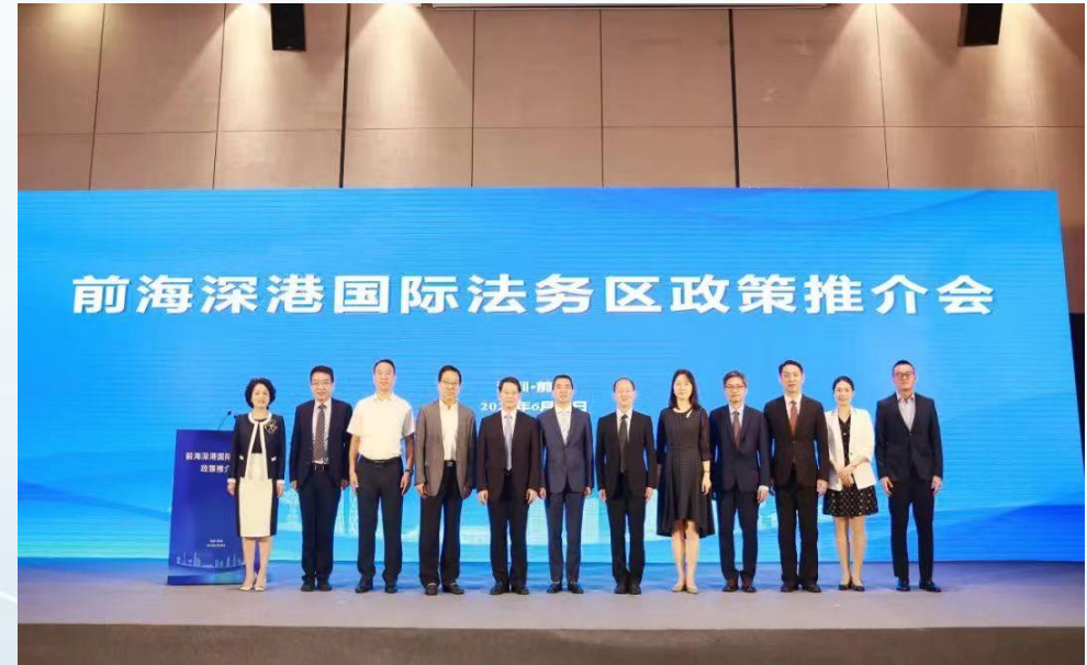
6月30日举行的前海深港国际法务区下策推介会暨港澳律师深圳执业研讨会